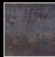
Ferroker export (Fondo Mar)

En este tipo de productos, SAURA S.L. se reserva el derecho a cambiar el tipo de revestimiento cerámico cuando lo crea conveniente, manteniendo la misma calidad que se oferta en catálogo.